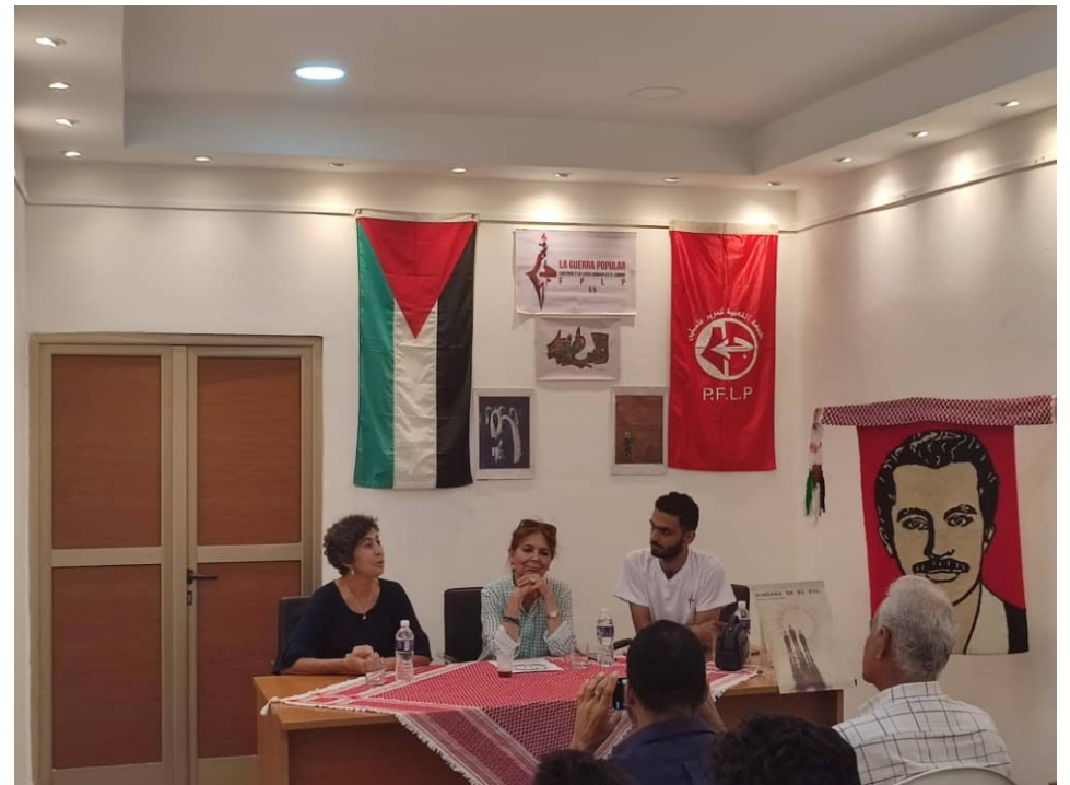
Presentación en Cuba de ese indispensable libro de Gassán Kanafani; «Hombres en el sol».

En Kuwait, escribió su primer cuento, «La camisa robada», por el que ganó su primer premio literario