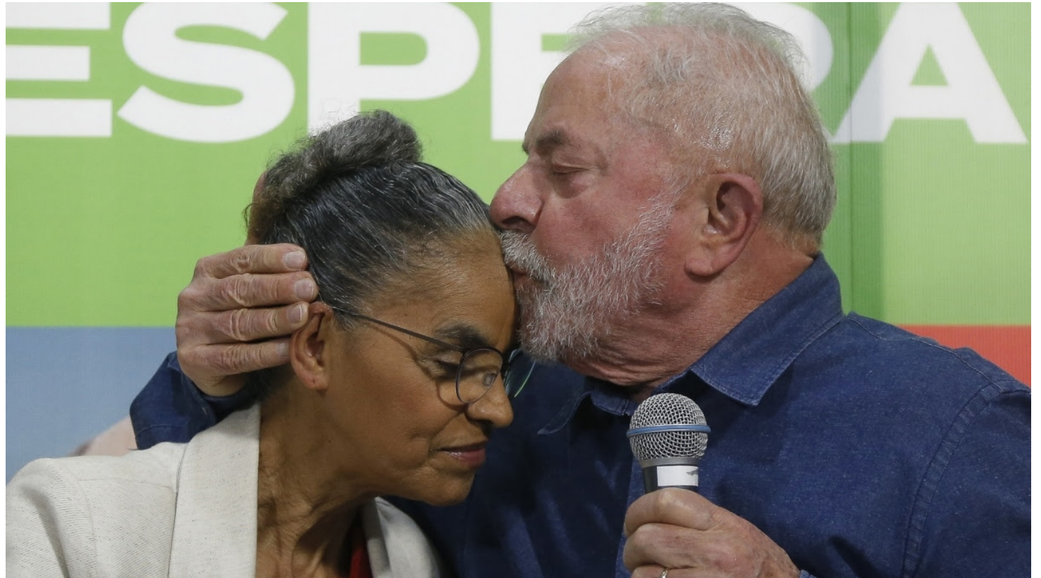
Lula habrá de enfrentar a muchos enemigos que acechan contra su mandato.

to tres veces a la presidencia de Brasil, fue elegido presidente en 2002 . El primero de enero del año siguiente subió por primera vez la rampa del Palacio del Planalto.