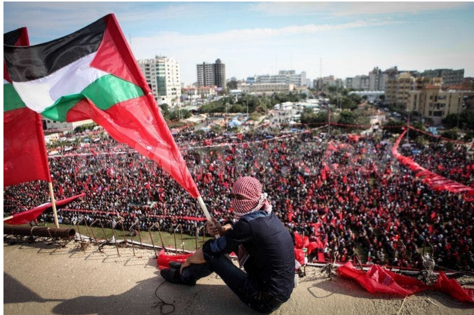
Impresionante celebración del 55 aniversario del FPLP: miles reafirmaron su compromiso con la lucha.

Dentro de su programa integral de lucha, el FPLP estableció liderar una revolución con todos los palestinos oprimidos.