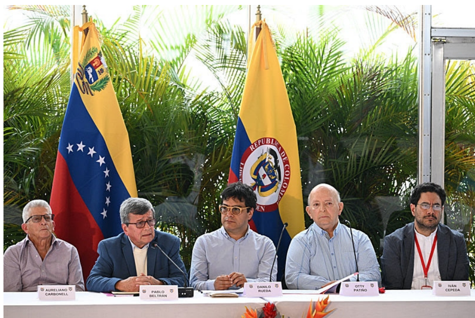
La mesa de diálogo en Caracas dio un balance optimista después de la primera ronda.

Las delegaciones del gobierno de Colombia y del grupo guerrillero Ejército de Liberación Nacional (ELN) concluyeron este lunes 12 en Caracas, capital de Venezuela, la primera ronda de negociaciones para la construcción de un acuerdo de paz.