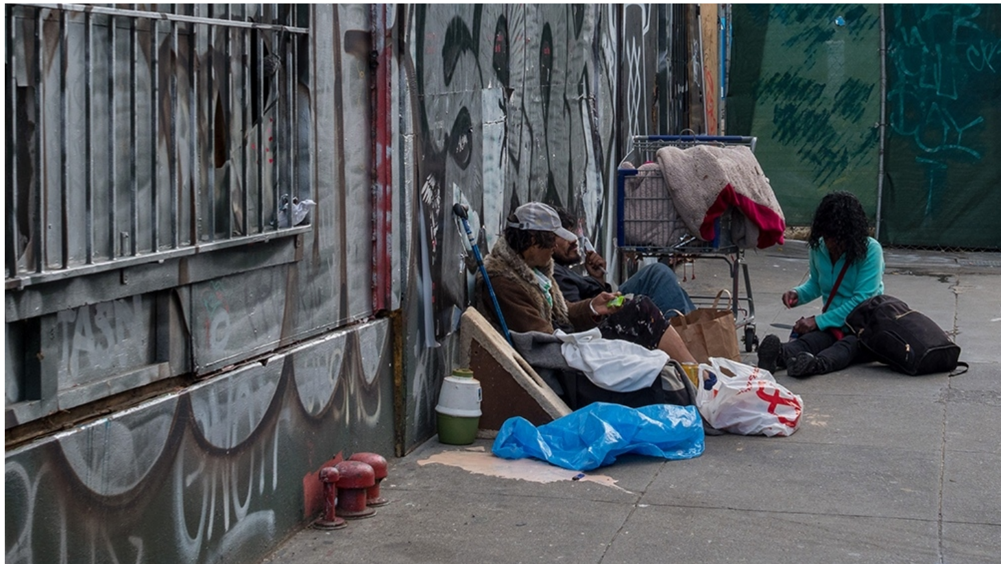
En un país donde hay alimentos y riquezas de todo tipo en abundancia, la pobreza sigue aumentando.

Gran parte de los argentinos están conmovidos por el ritual de esta religión contemporánea que es el fútbol. Estos ceremoniales llegan a tal punto que no faltan sectores minoritarios que consideren que hay argentinos que tienen a la pelota por cabeza.