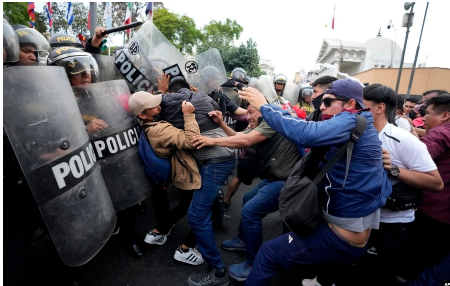
La represión policial y militar contra la población ha costado numerosos asesinados y heridos.

Debido a la historia de inestabilidad y conflicto entre poderes, una de