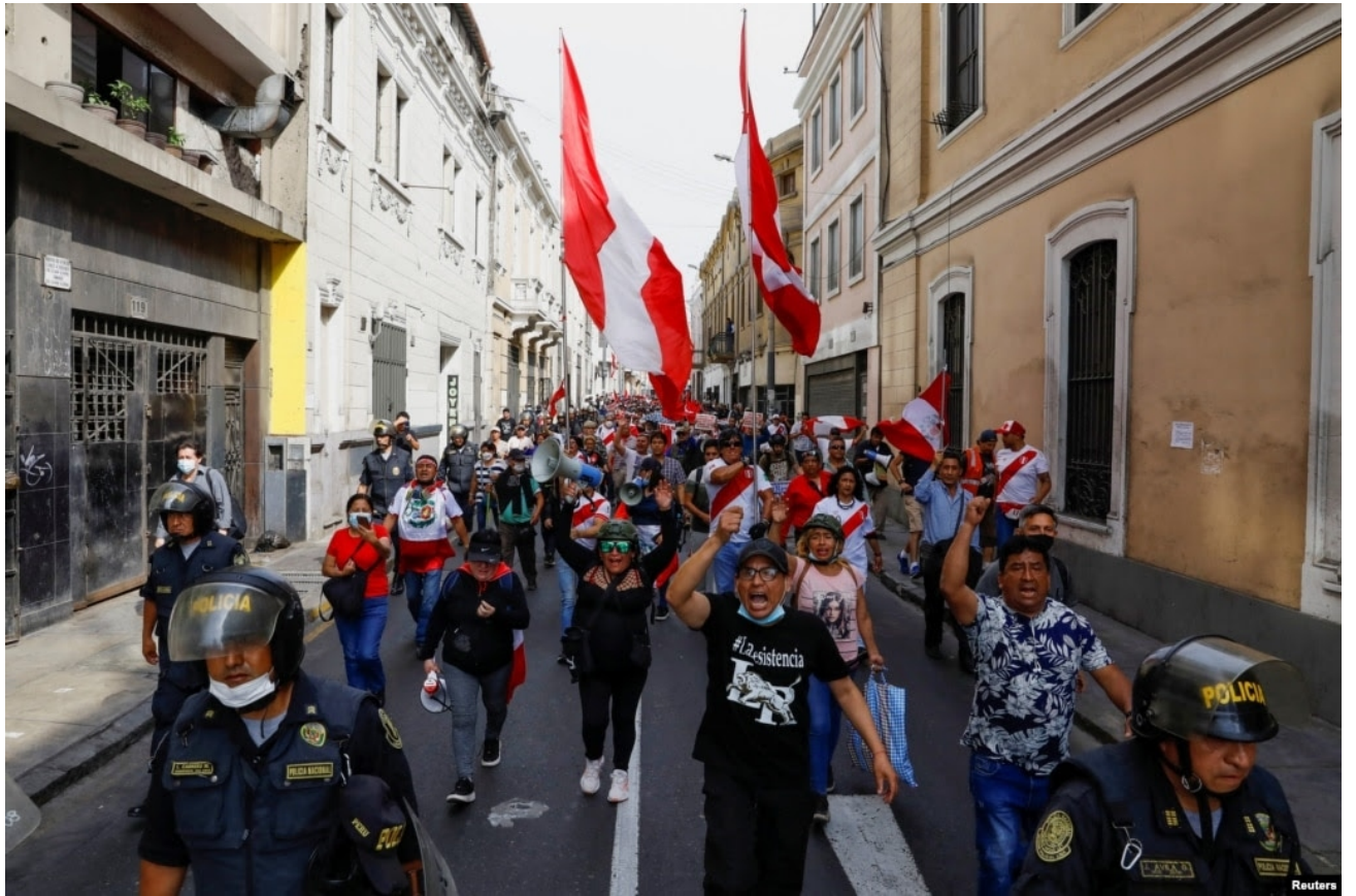
Movilizaciones multitudinarias en todo el país repudian el golpe derechista.

Este recuento no es casual. Sirve para confirmar lo que alguna vez dijera como maleficio Gonzalo Rose adjudicándole a una voluntad suprema una práctica siniestra: "Deguella, Dios de los incrédulos / al que intente cazurro / transformar al Perú".